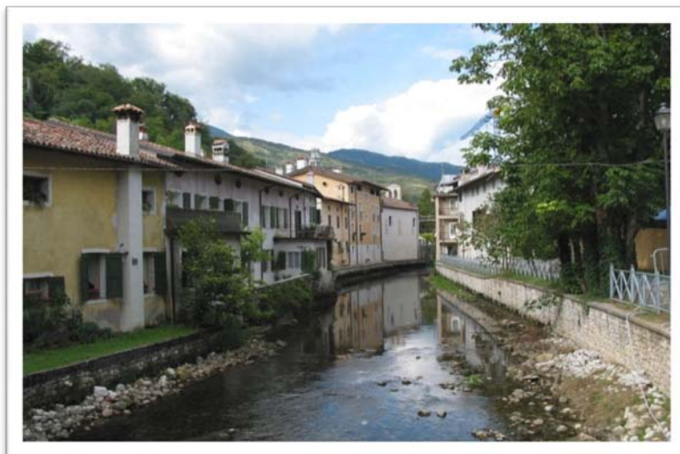
(scorcio di Polcenigo)

È con grande piacere che l'ASD ARCHI NEL BOSCO dà il benvenuto a coloro che parteciperanno al primo Campionato italiano per squadre di società F.I.D.A.S.C.